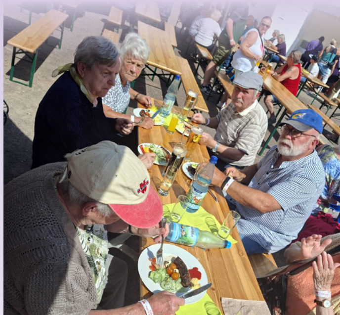
Sommerfest der wbg auf dem Schlosshof in Gotha