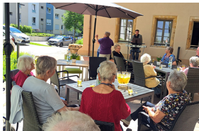
↑ Pfingstfest mit Live-Musik, ↓ Besuch im Wildkatzenpark

Im September stand ein nächster Höhepunkt auf dem Programm. Unsere Seniorinnen und Senioren durften sich auf einen Ausflug in den Wildkatzenpark nach Hütcheroda freuen, ein Naturerlebnis, das für frische Eindrücke und nette Gespräche sorgte.