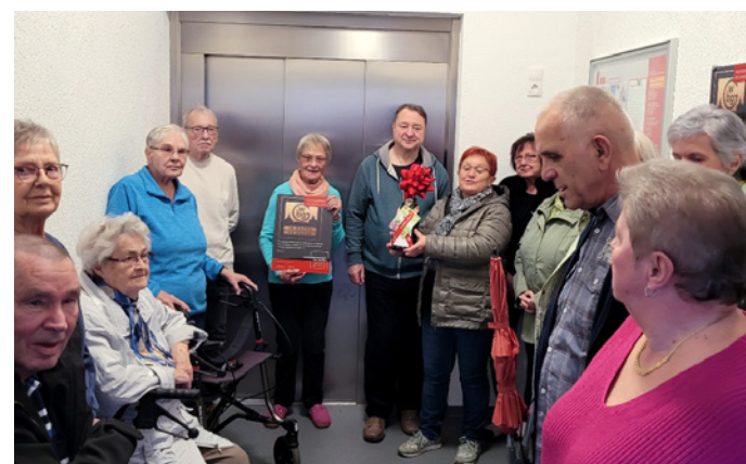
Hausgemeinschaft Berg 4