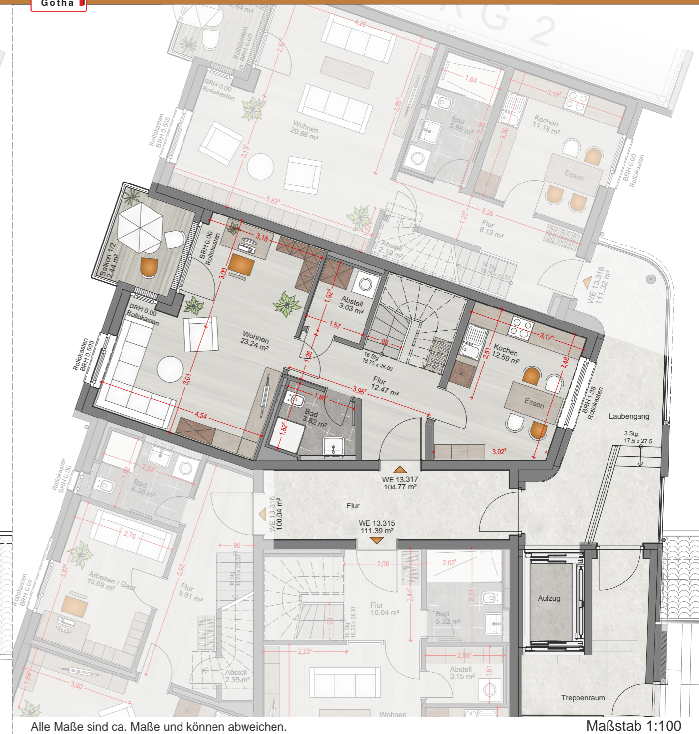
4.OG - Maisonette Etage 2

Alle Maße sind ca. Maße und können abweichen.