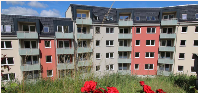
Blick auf die neu sanierten Wohnungen im Berg 1-13 mehr dazu auf Seite 5