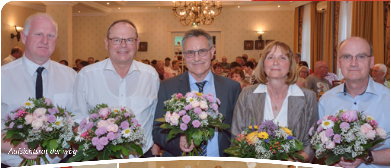
Aufsichtsrat der wbg