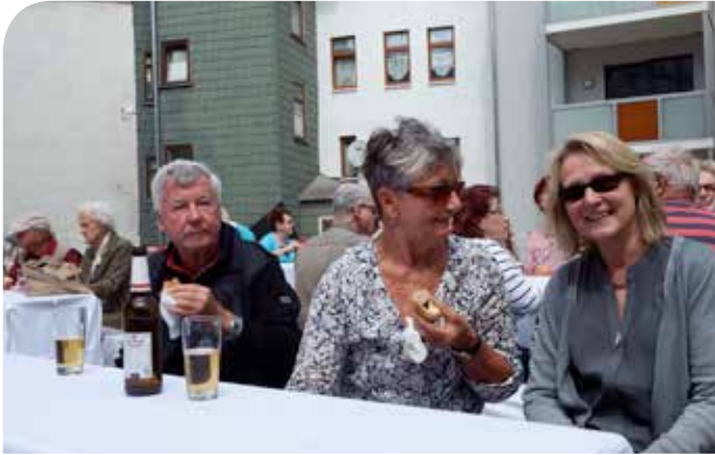
Die Gäste lassen es sich schmecken...