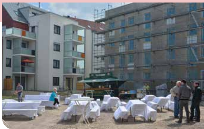
Das Brühlkarree erwartet seine Gäste