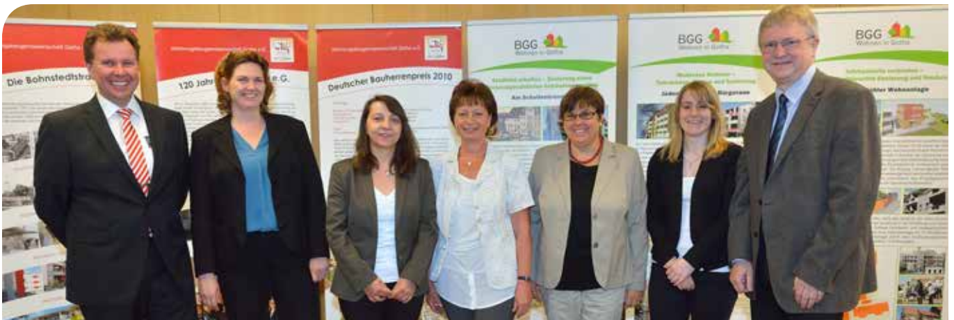
Akteure der Stadtentwicklung