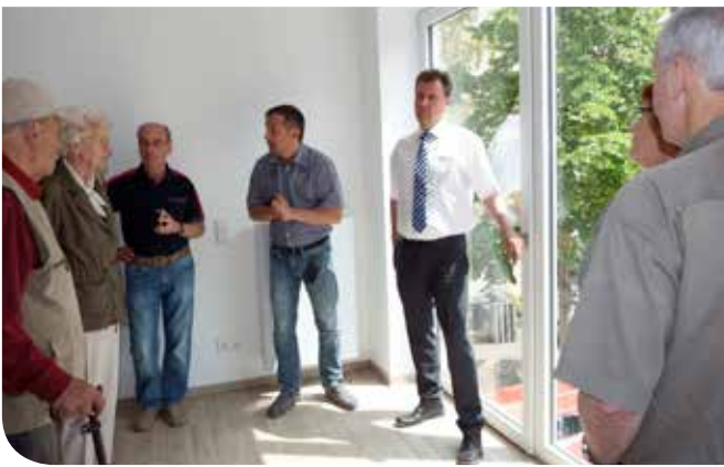
Neugierige Fragen bei der Besichtigung