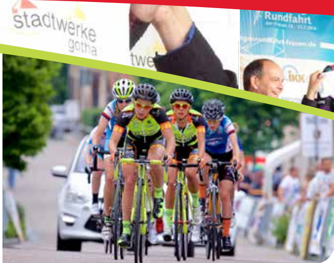
Internationale Thüringenrundfahrt der Frauen