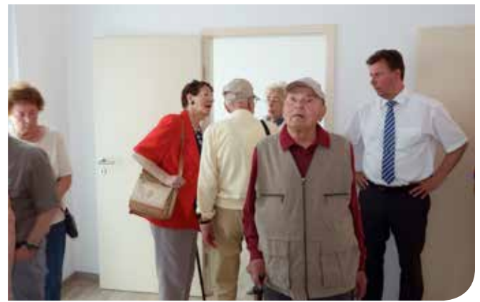
Erste Einblicke in die Wohnungen