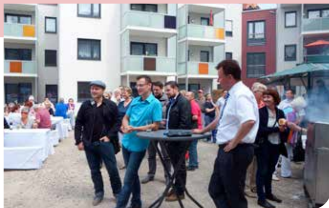
Platz für angeregte Gespräche