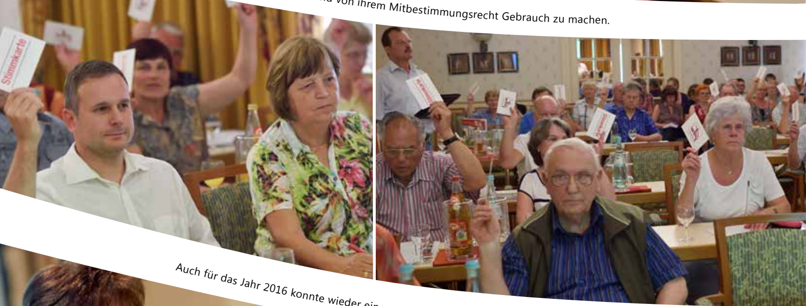
Auch für das Jahr 2016 konnte wieder eine positive Entwicklung bestätigt werden.