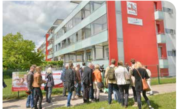
Beim gemeinsamen Rundgang durch die Altstadt