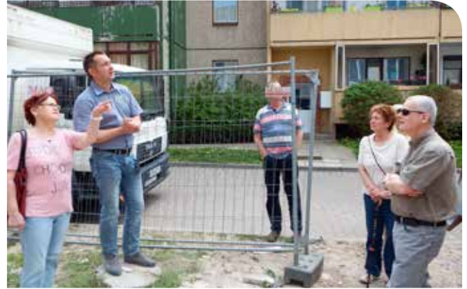
...und auch alles genau erklären