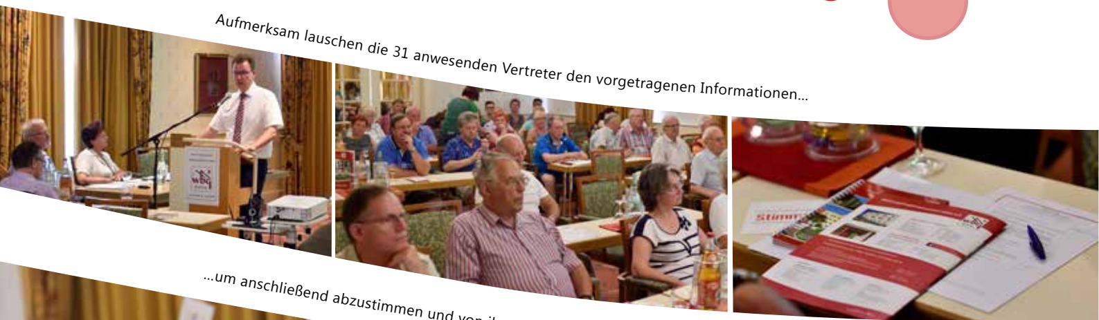
...um anschließend abzustimmen und von ihrem Mitbestimmungsrecht Gebrauch zu machen.