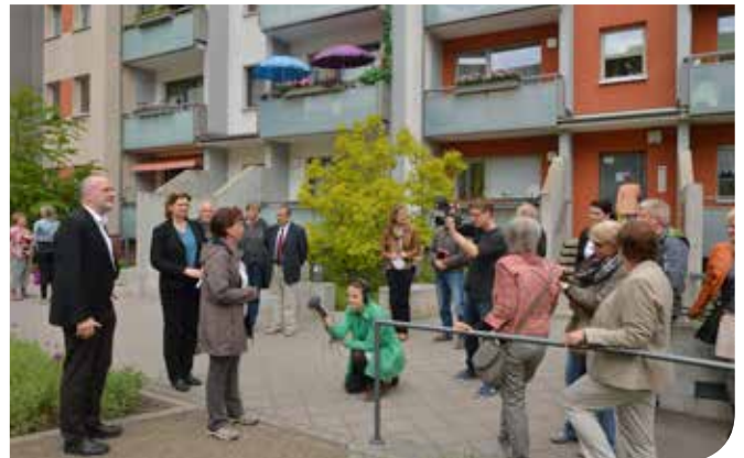
Im Fokus der interessierten Zuhörer