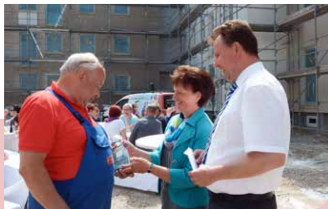
Die Vorstände überreichen ein Geschenk an das Geburtstagskind des Tages