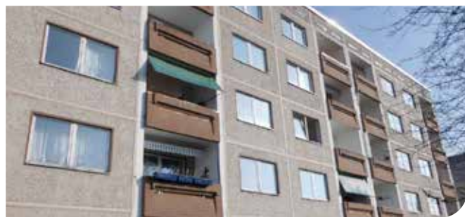
Clara-Zetkin-Straße 64, 65, 66 - Sanierung Fassade, Erneuerung Fenster