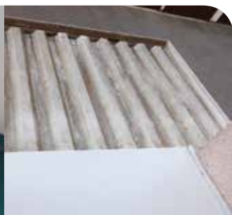
Dr.-Hans-Loch-Straße 1 bis 5 - Beschichtung der Balkon- und Hauseingangsstahlkonstruktion, Umbau der Balkontwässerung