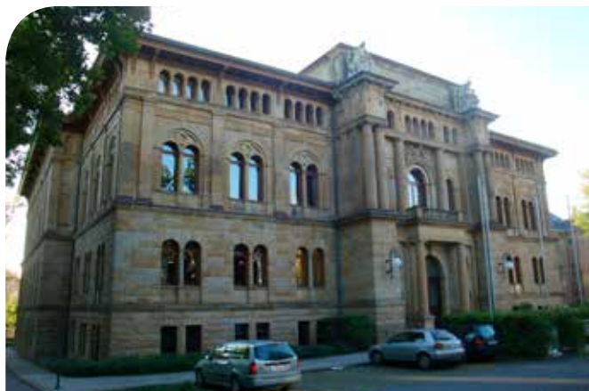
Außenansicht des Museums

Es dürfte den Gothaern schon bekannt sein, dass sich in unserer Bahnhofstrasse 3a ein Versicherungsmuseum befindet, welches für jedermann zugänglich ist. Dieses Museum wurde 2009 in den ehemaligen Vorstandsräumen der Gothaer Lebensversicherungsbank eröffnet und ein Förderverein kümmert sich mit ehrenamtlichen Museumsführern um die Erhaltung und Weiterentwicklung dieses Museums. Hier wird die firmenunabhängige Entwicklung der Versicherungswirtschaft beschrieben. Aber auch eine Würdigung von Ernst Wilhelm Arnoldi wird vollzogen, dem Begründer des modernen Versicherungswesens in Deutschland. Arnoldi gründete 1820 die „Feuerversicherungsanstalt des Deutschen Handelsstandes“ und 1827 „Lebensversicherungsbank für Deutschland“, beides Versicherungsvereine auf Gegenseitigkeit. Die Standorte beider Versicherungen wechselten mehrmals in Gotha bis letztlich in der Bahnhofstrasse Ende des 19. Jhd. nach Plänen der Architekten Bohnstedt und Elbo diese prächtigen Bauten entstanden.