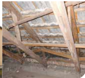
Enckestraße 16, 18 - Dachsanierung, Abtragen alter Schornsteine und Fassadensanierung