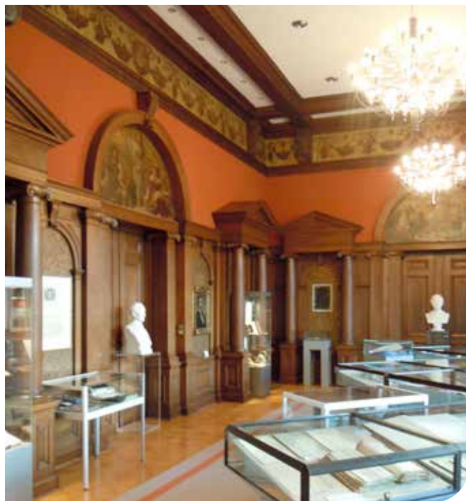
Saal mit Exponaten

sicherungsmuseum. Das ganze Haus erstrahlt in seinem historischen Charme, und der Besucher kann sich so leicht in die frühe Zeit des Versicherungswesens hineinversetzen. Auch wenn die Räumlichkeiten des Museums begrenzt sind, versuchen engagierte Mitarbeiter im Ehrenamt in Sonderausstellungen und auch in Sonderführungen die vielen Facetten der Assekuranz von der Vergangenheit bis in die Gegenwart den interessierten Besuchern zu zeigen. Diese Sonderausstellungen werden rechtzeitig in der Presse veröffentlicht, aber auch die interessante Homepage des Museums ( www.dmv-gotha.de ) ist tagaktuell und für jedermann zugänglich.