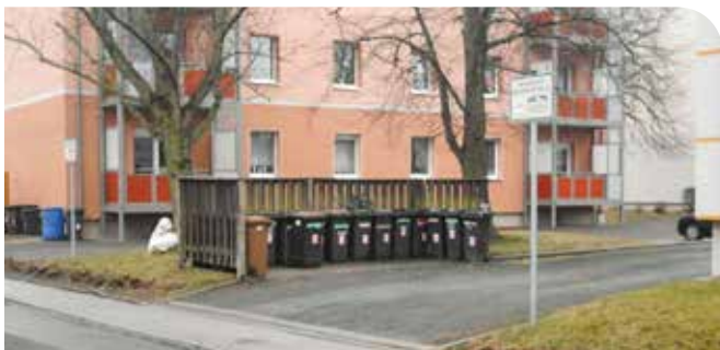
Kohlstockstraße 1 bis 13 und 2, 4, 6 - Gestaltung Außenanlagen