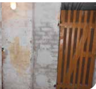
Straße der Einheit 12 bis 16 - Instandsetzung Keller (Wände und Böden)