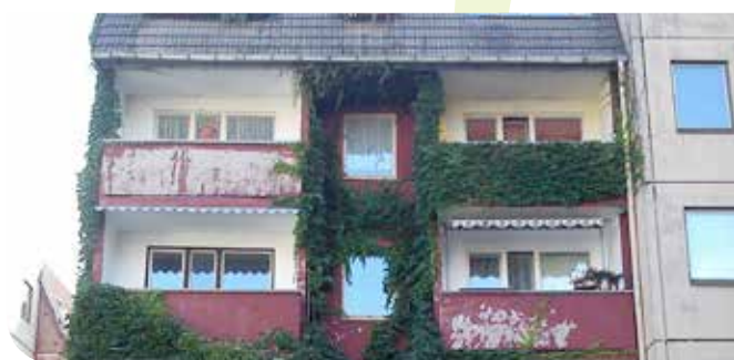
Klosterstraße 8 – 10, Erneuerung Fenster, Sanierung Fassade und Mansarddach, Fugensanierung, Balkonanbau