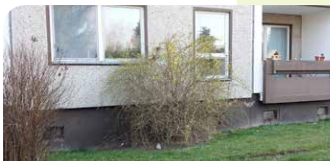
Clara-Zetkin-Straße 67 – 68, Sanierung Fassade, Fugensanierung, Erneuerung Fenster, Balkonanbau