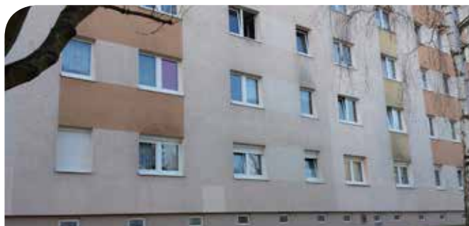
Otto-Geithner-Straße 3 – 17, Sanierung Fassade

den südseitigen Balkonanbau. In der Clara-Zetkin-Straße 67 – 68 wurden ebenfalls Fassade, Fugen und Fenster saniert sowie die langersehnten Balkone angebaut. Der Balkonanbau in der Friemarers Straße rundete das Baugeschehen 2014 ab.