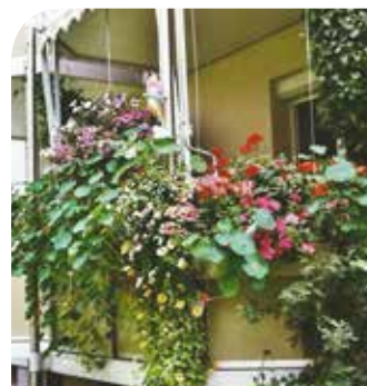
Brigitte Ortlepp, Straße der Einheit