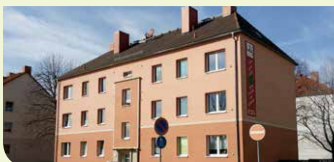
Friemarers Straße 57, Balkonanbau