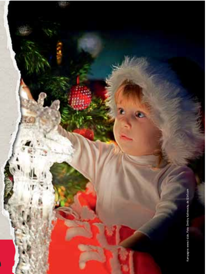
Kampagne www.t.d.de